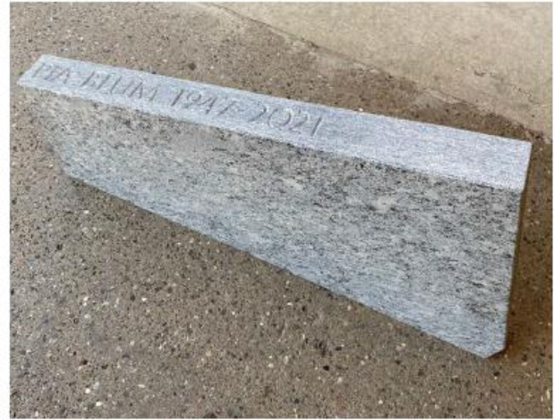
Inscribenbuch, Muster 1:1

Die einzelnen Steinplatten symbolisieren eine Buchseite, sodass das Inschriftenbuch ständig fortgeschrieben wird. Die Seiten können einzeln eingesetzt und entfernt werden. Dem beauftragten Steinbildhauer wird dadurch ermöglicht, bei Lieferung einer Seite (Steinplatte) die nächste gleich ins Atelier mitzunehmen. Dadurch werden die Lieferfristen verkürzt, und die Grabplatten dürften in aller Regel zum Bestattungstermin bereits vor Ort sein. Somit sind die Beschriftungen bei speziellen Anlässen und Feiertagen wie z.B. Allerheiligen vollständig, was den Angehörigen erfahrungsgemäss ein grosses Bedürfnis ist.